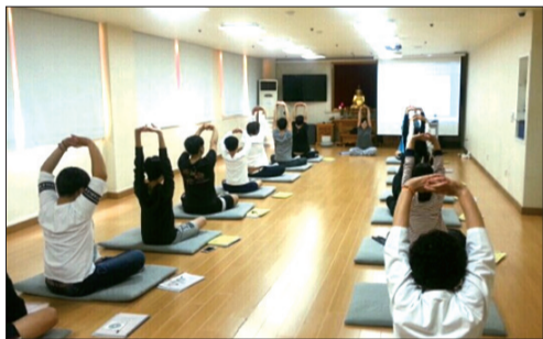
청소년 집중명상 심화반 수업중에서

지난 9월 12일부터 매주 토요일 오전 10시~12시 까지 청소년 참선 심화반과정이 진행되고 있습니다.