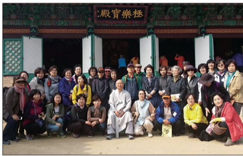
극락보전 앞에서 함께 한 금강선원 불자들

지난 10월 21일(수) 금강선원 불자들은 백담사로 순례법회를 다녀왔습니다. 오전 7시 서울을 출발하여 도