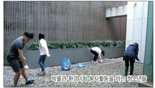
박물관 환경미화봉사활동을 하는 청소년들