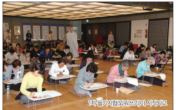
1차 필기시험(의위쓰기)이 시작되고