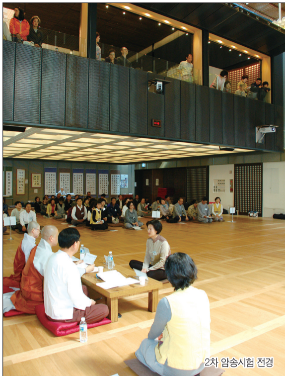
2차 암송시험 전경

단체부문(7팀) ▶ 우수상(탄허불교문화재단이사장 각100만원)-대치선등경수가기합창단 ▶ 특별상(서울특별시장 50만원)-가사체 한글 금강경 서울독송회 ▶ 특별상(강남구청장 50만원)-수서경철서 경승실 ▶ 장려상(탄허기념박물관장 각20만원)-금강결스, 선재팀