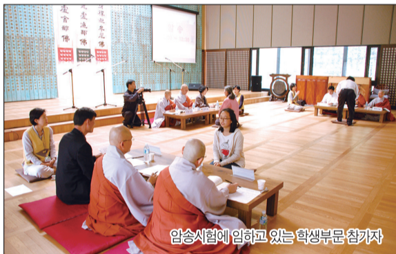
암송시험에 임하고 있는 학생부문 참가자