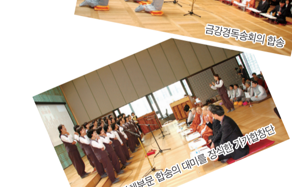
단체부문 합송의 대미를 장식할 가기합창단