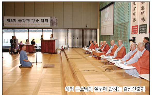
헤거 큰스님의 질문에 답하는 결선진출자