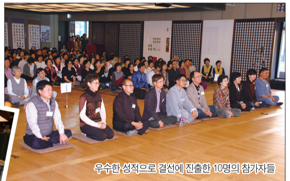
우수한 성적으로 결선에 진출한 10명의 참가자들