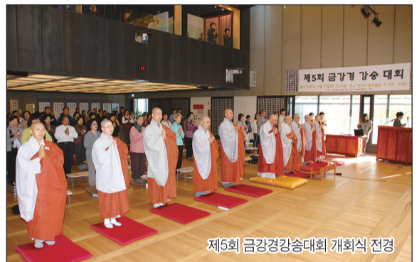
제5회 금강경강송대회 개회식 전경