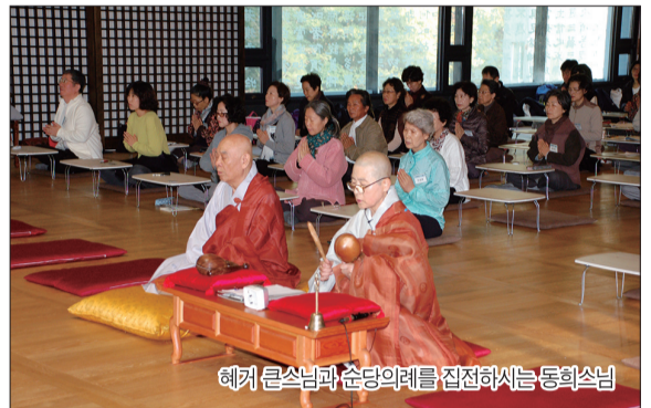
헤거 큰스님과 순당의례를 집전하시는 동희스님