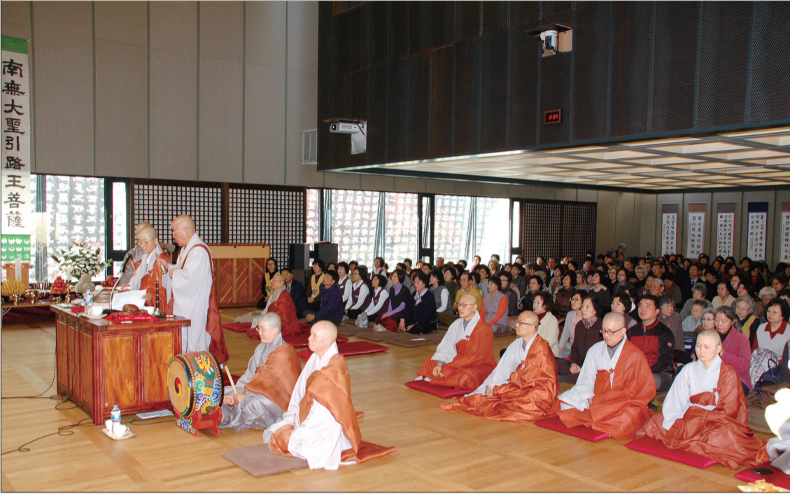
지난 2014년 수륙대재 중에서

발행처 : 대한불교조계종 금강선원 / 발행인 : 혜거스님(안동수) / 발행소 : 서울특별시 강남구 개포로82길 11 삼우빌딩 405호(135-243) / 편집 : 금강선원 편집부 / TEL : 445-8484 FAX : 445-8043 / 등록번호 : 서울라-10888