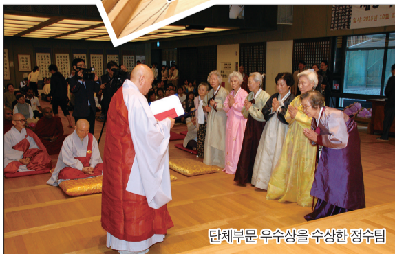
단체부문 우수상을 수상한 정수팀