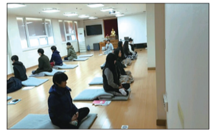
집중표를 활용하여 시선과 정신을 한곳에 모아 집중하는 훈련인 집중명상과 학습계획과 미래를 설계해보는 주제명상으로 집중력과 지구력을 키워줍니다.