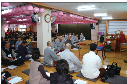
명상 교육과정 중 혜거 큰스님의 강의를 듣는 수강생들

지난 3월 12일(토) 오후 2시 금강선원 대법당에서 ‘지혜와 평화의 길, 명상아카데미 대강좌’ 프로