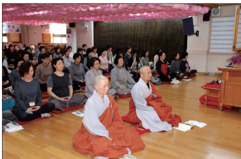
이론 강의 후 진행되는 좌선수업 중에서

1년에 2번, 총 14주 과정으로 진행되는 금강선원 기초참선반이 지난 3월 7일(월) 오후 2시 30분 대법당에서 개강되었습니다. 불자뿐 아니라 참선