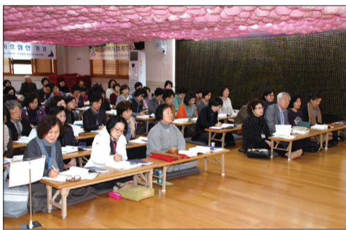
불교 입문과정 중 기초교리를 배우며