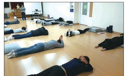
이완명상과 오체투지를 통해 몸과 마음을 이완시켜주어 한주간의 스트레스를 풀어줍니다.

2015년 7월~9월까지 청소년 기초과정을 마친 학생들이 2015년 9월부터 현재까지 매주 토요일 10시부터 12시까지 2시간동안 금강선원에서 헤거 큰스님 법문을 비롯하여 이완명상과 오체투지, 집중명상, 전두엽 훈련 등 다양한 명상 프로그램으로 진행하고 있습니다.