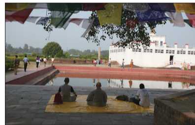
룸비니 Mayadevi temple