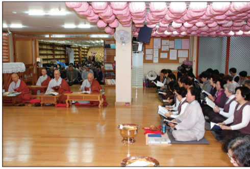
정성을 다한 천도재를 회향하며

지난 3월 2일(수) 오전 10시 30분 대법당에서 신년 7일 합동천도재 회향이 있었습니다.